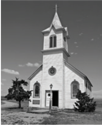
Hội Thánh Địa Phương

1. Thân thể Đấng Christ (I Cô-rinh-tô 12:1-7)