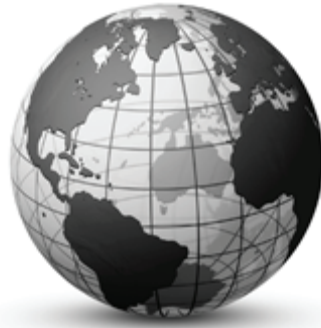
Hội Thánh Toàn Cầu